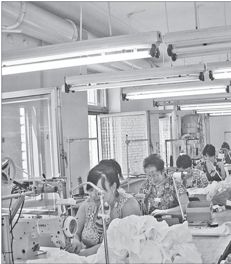
В этом году коллектив Кедровской швейной фабрики отметит 50-летний юбилей

До этого главным промышленным объектом в Кедровом было Исетско-Аятское торфопредприятие (ИАТП), ориентированное на оборонку. Реформа меняла приоритеты. Вот цитата из решения исполкома Кедровского сельсовета от 21 августа 1967 года: «для расширения Кедровской швейной фабрики и устройства дополнительно 150–200 человек вторых членов семьи и временно сокращенных рабочих с торфопредприятия просить дирекцию ИАТП передать Кедровской швейной