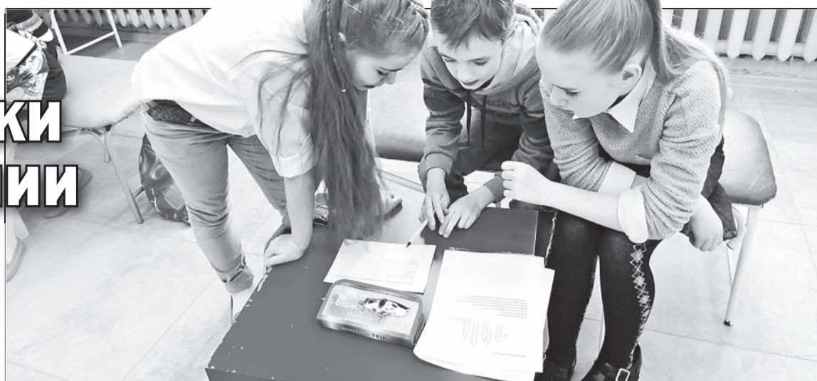
«Стилисты» школы №3 решают экономические задачи

Команды представили себя в презентациях, сценках и даже стихотворным текстом. На скорость решали задачки, кроссворд и вспоминали термины из области экономики. Кульминацией стала защита экономических проектов по теме: «Ретроновизна». Ребята не только показали изде-