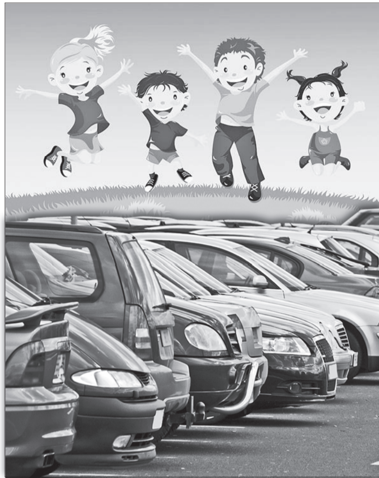
Фото из интернет-источников. Коллаж Светы Мадельевой

В селе Балтым назрел конфликт между родителями детского сада № 8 и жителями прилегающих к детсаду домов