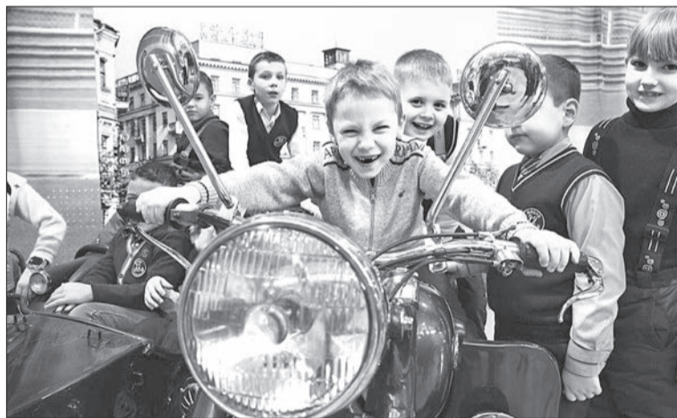
«Это не компьютер: всё по-настоящему»

— Смотри, Димон, как интересно сделали. Я бы еще добавил шашечки на желтый