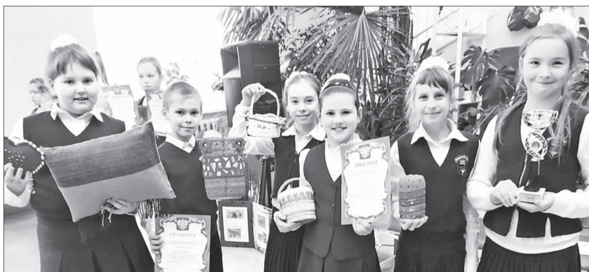
Победители конкурса — команда «Профи» (школа № 2)

лия, сделанные собственными руками, но и доказали, насколько такие вещи экономят семейный бюджет и приносят радость в качестве подарков.