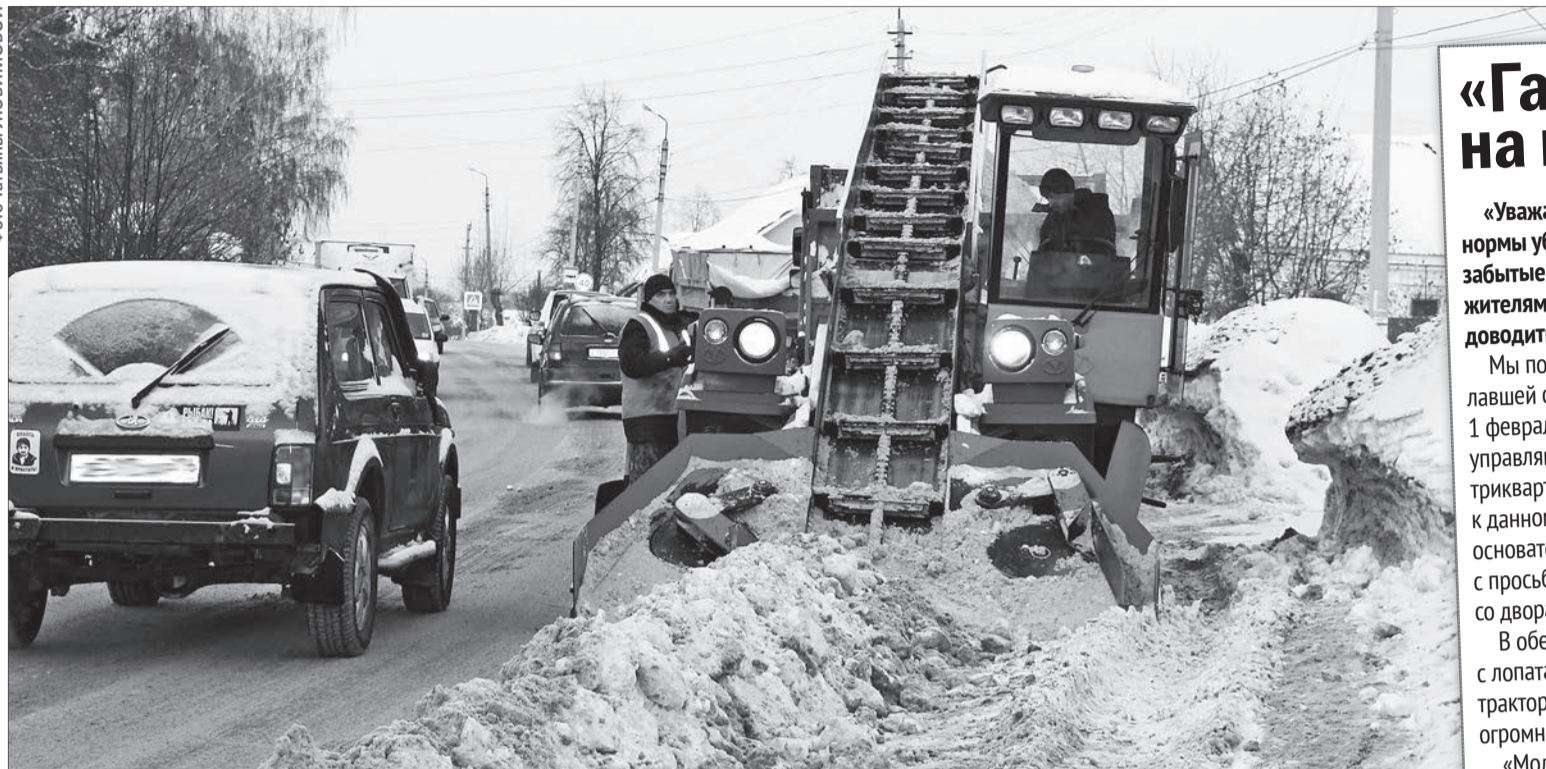
Улица 40 лет Октября — 2 февраля здесь вовсю кипела работа: с пяти метров дороги — полный КАМАЗ снега

Зима нынче особо снежная. Коммунальные службы не справляются с выпавшими объёмами снежной массы: обочины Верхней Пышмы в сугробах чуть ли не по два метра высотой, дворы и дороги в глубоких колеях