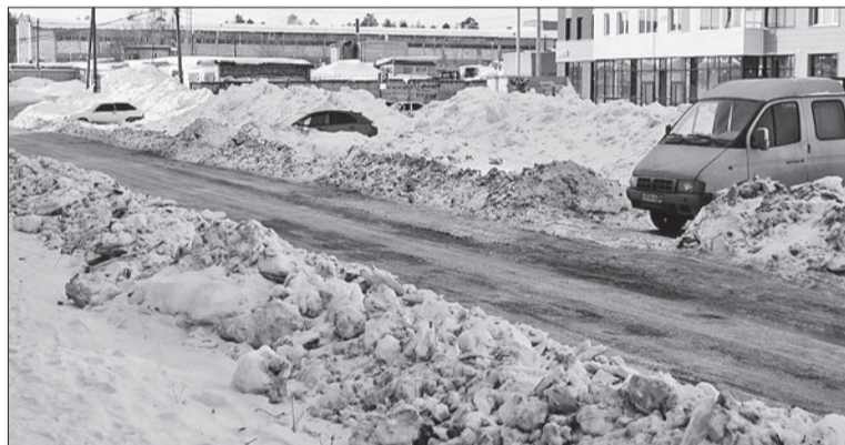
А из окна редакции видна вот такая улица Юбилейная

Наши снегопогрузчики, самосвалы, КАМАЗы, трактора работают ежедневно и днём и ночью по графику. Если требуется, то привлекаем машины со стороны. Ночью стараемся расчистить улицы с интенсивным потоком транспорта, такие как 40 лет Октября, Уральских рабочих. Днём делаем подсыпку, грейдеры занимаются расширением дорог, чистим пешеходные переходы. По тех-