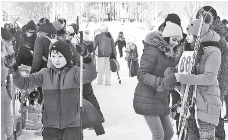
Активная подготовка перед стартом